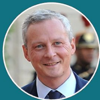
Bruno Le Maire

Ministre de l'Economie et des Finances (invitation en cours)