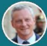
Bruno Le Maire Ministre de l'Economie et des Finances (invitation en cours)

Colloque national - Assemblée nationale - 15 janvier 2020 - 14h-18h