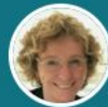
Muriel Pénicaud Ministre du Travail (invitation en cours)

1 Quelle visibilité sur les impacts des technologies sur le travail, les compétences, les emplois ?