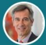
Godefroy de Bentzmann Président SYNTEC numérique