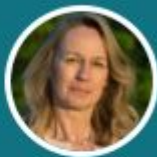
Constance Le Grip Vice-Présidente de la Commission des Affaires culturelles et de l'Education, Assemblée nationale