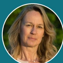
Constance Le Grip

Ministre de l'Economie et des Finances (invitation en cours)